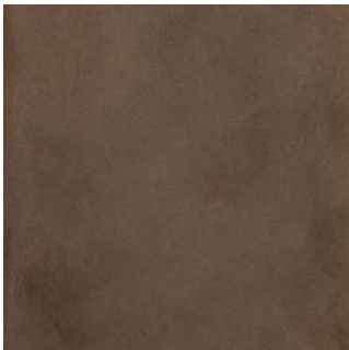
Laiton bronze clair