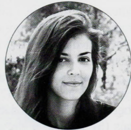
Lampadaire "Tilt", Agnès Bardelot