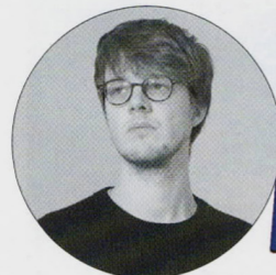
Fauteuil "Otto", Nicolas Girard