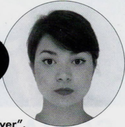
Fauteuil "Jardin d'hiver", Myriam Peres